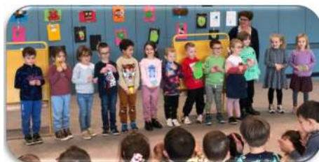
Un spectacle des enfants pour les enfants, puis des jeux de société en maternelle.

et l'action « Tous en bleu pour dire non au harcèlement »