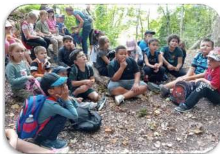
En ce début d'année : des sorties en forêt.