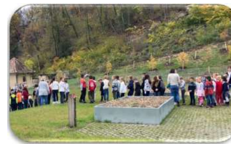
Exercice d'évacuation réussi pour tous les élèves....