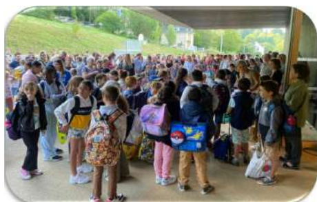
Une belle rentrée dans le nouveau pôle scolaire.... Les enfants étaient heureux. Un petit chamois a observé tout cela depuis tout là-haut...