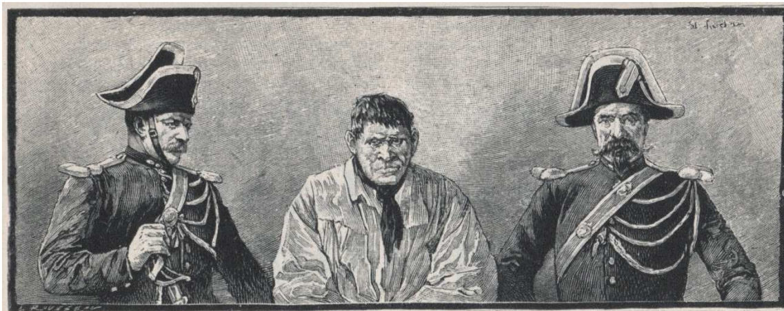
Dessin d'époque montrant Jud lors de son arrestation (Miroir de l'Histoire)