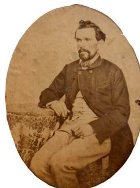
Reproduction photographique rectifiée d'un daguerréotype de Charles Jud (1860)