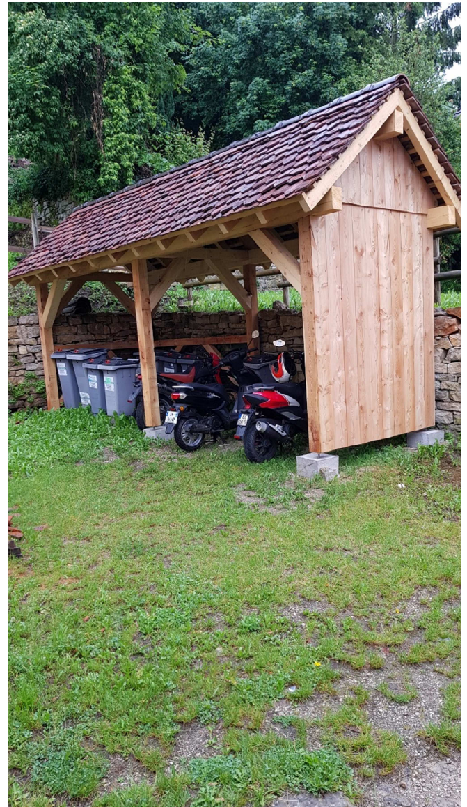
L'abri poubelle réalisé en face de la mairie